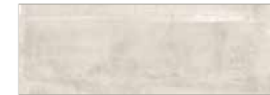
15 041 sand sable