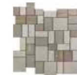
30 118 dark-sand dark-sable

30 × 30 Mosaik, Feinsteinzeug, netzverklebt Mosaic, porcelain stoneware, glued on mesh-type net Mosaïque, grès cérame, collé sur maillage