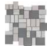
30 123 light-grau light-grey light-gris