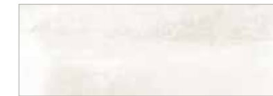
15 040 beige

35 × 100 CAMEO Grundfliese, rektifiziert, matt Plain Tile, rectified, mat Uni, rectifié, satiné