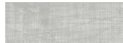
15 048 silber silver argent

30 × 30 Mosaik, Feinsteinzeug, netzverklebt Mosaic, porcelain stoneware, glued on mesh-type net Mosaïque, grès cérame, collé sur maillage