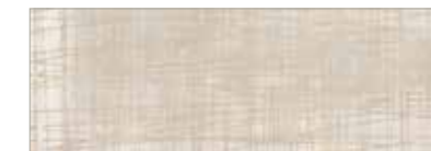
15 043 kupfer copper cuivre