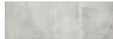
15 046 zement cement ciment