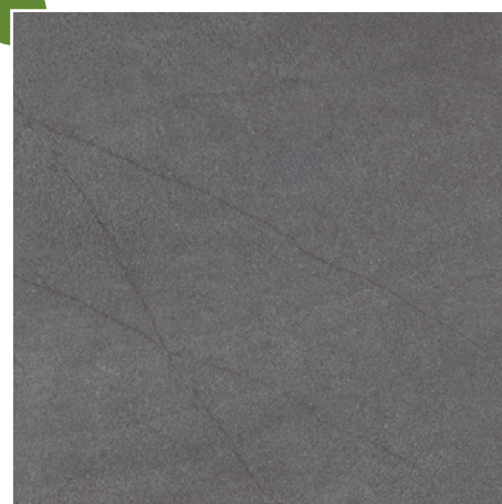
60 × 60/2 cm Y-KOS 345 BASALT