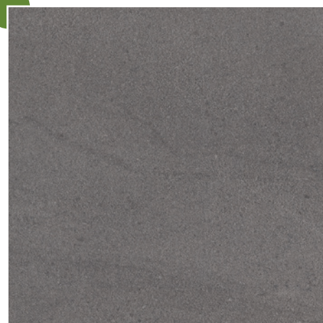
60 × 60/2 cm Y-KOS 348 LAVA